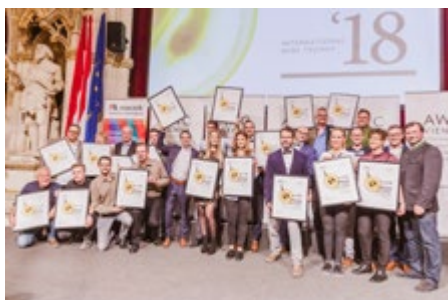
La Nuit de Gala / Serata di Gala del Vino