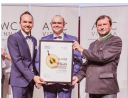
La Nuit de Gala / Serata di Gala del Vino

Nel Municipio di Vienna La premiazione e la presentazione dei migliori vigneti dell'awc vienna 2021 nell'ineguagliabile cornice imperiale del Municipio di Vienna alla presenza di più di 3.000 professionisti del settore. Il Municipio di Vienna si pone in questa giornata al centro del mondo vinicolo.