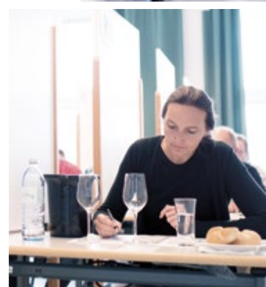
La dégustation à l'aveugle - unique au monde Degustazione alla cieca - unica di queste dimensioni